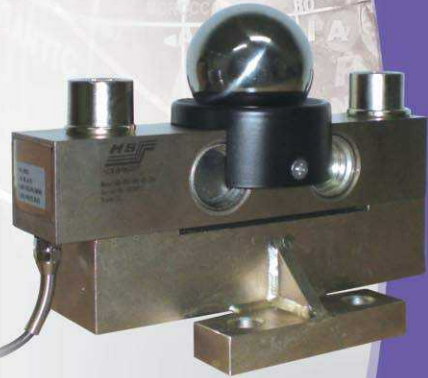
Digital Load Cell

數字式傳感器其結構，一體成型俱有良好的密閉性設計，其防護等級達國際標準等級IP68，可完全適用於惡劣的工業環境，另自動垂直對位校準的機構設計更可確保系統的穩定度及精確度。